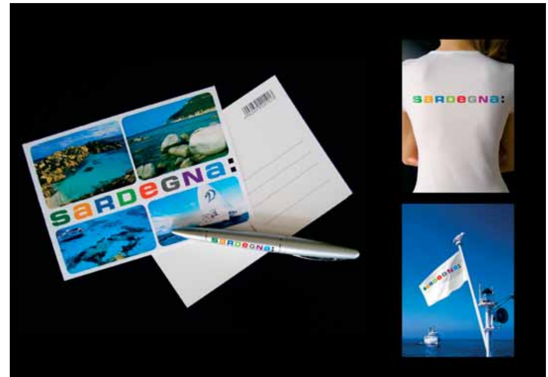
In alto e a sinistra: logo, articolazioni e applicazioni di Pentagram, Londra.