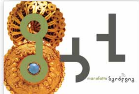
Genesi, articolazione e applicazioni del logotipo progettato da Marco Tortoioli Ricci con Laura Bortoloni e Matteo Guidi, Bcpt, Perugia.